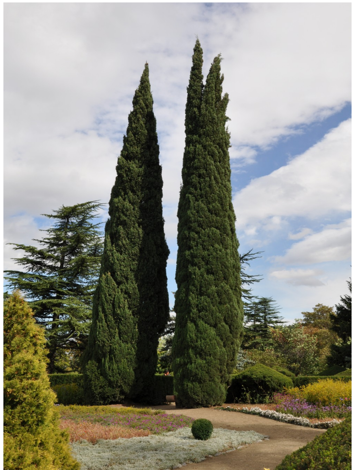
Cupressus sempervirens horizontalis