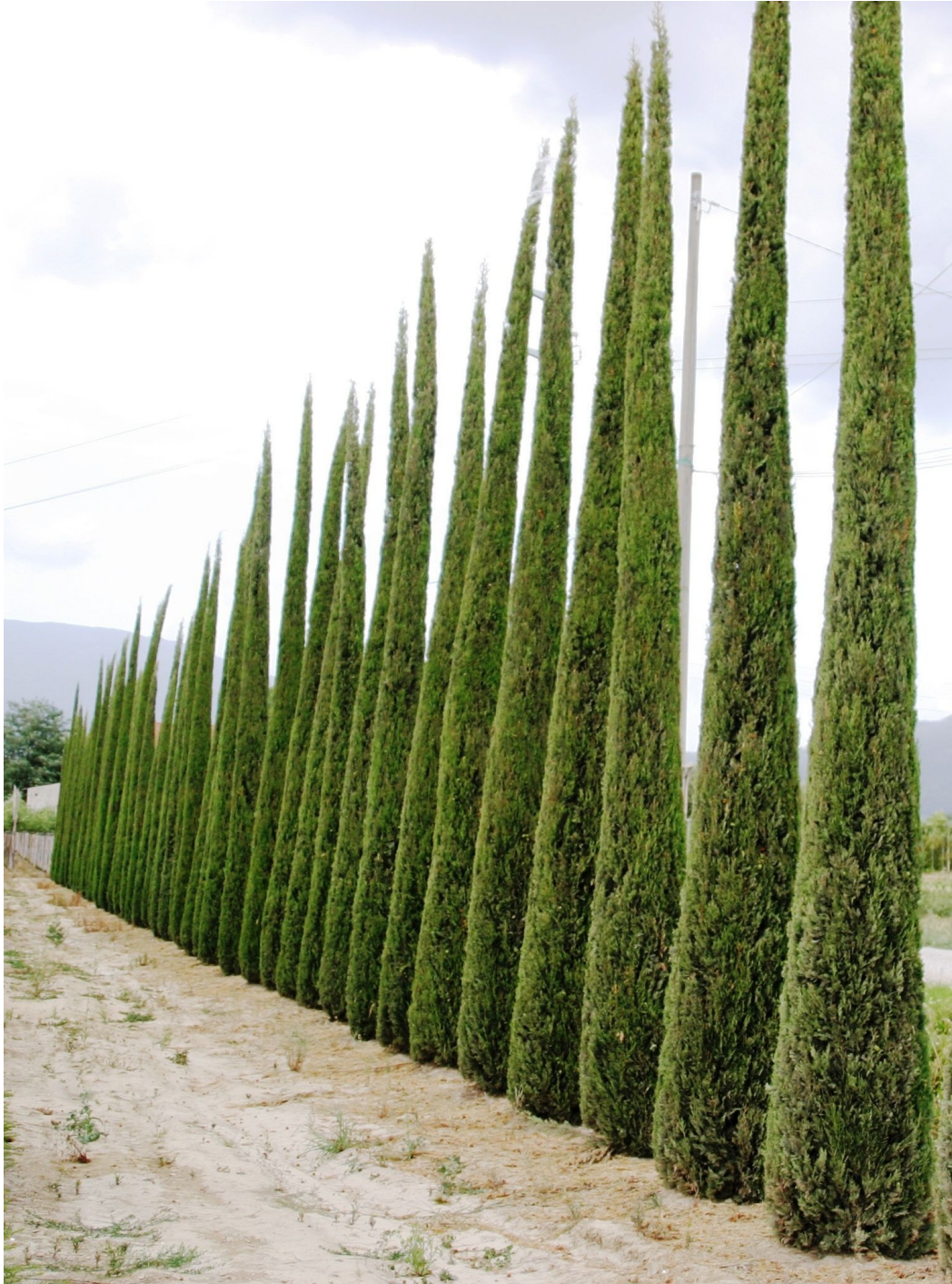
Cupressus sempervirens Stricta