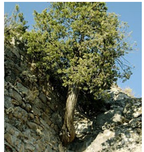
Vista de la planta