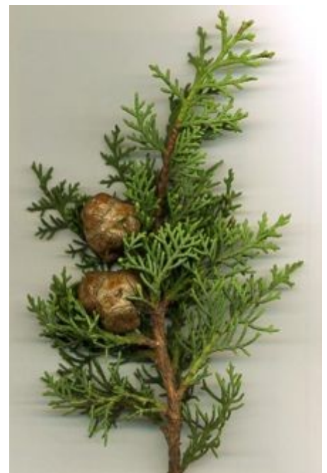
Detalle de hojas y conos.

Se ha cultivado extensamente como árbol ornamental durante milenios lejos de su lugar de origen, principalmente en la región mediterránea central y occidental y en otras áreas similares con veranos calientes y secos, e inviernos suaves y lluviosos, tales como California, el sudoeste de Sudáfrica y la zona meridional de Australia). Puede también prosperar con éxito en áreas más frías, con veranos más húmedos, como en las Islas Británicas, Nueva Zelanda y el oeste de Oregón.