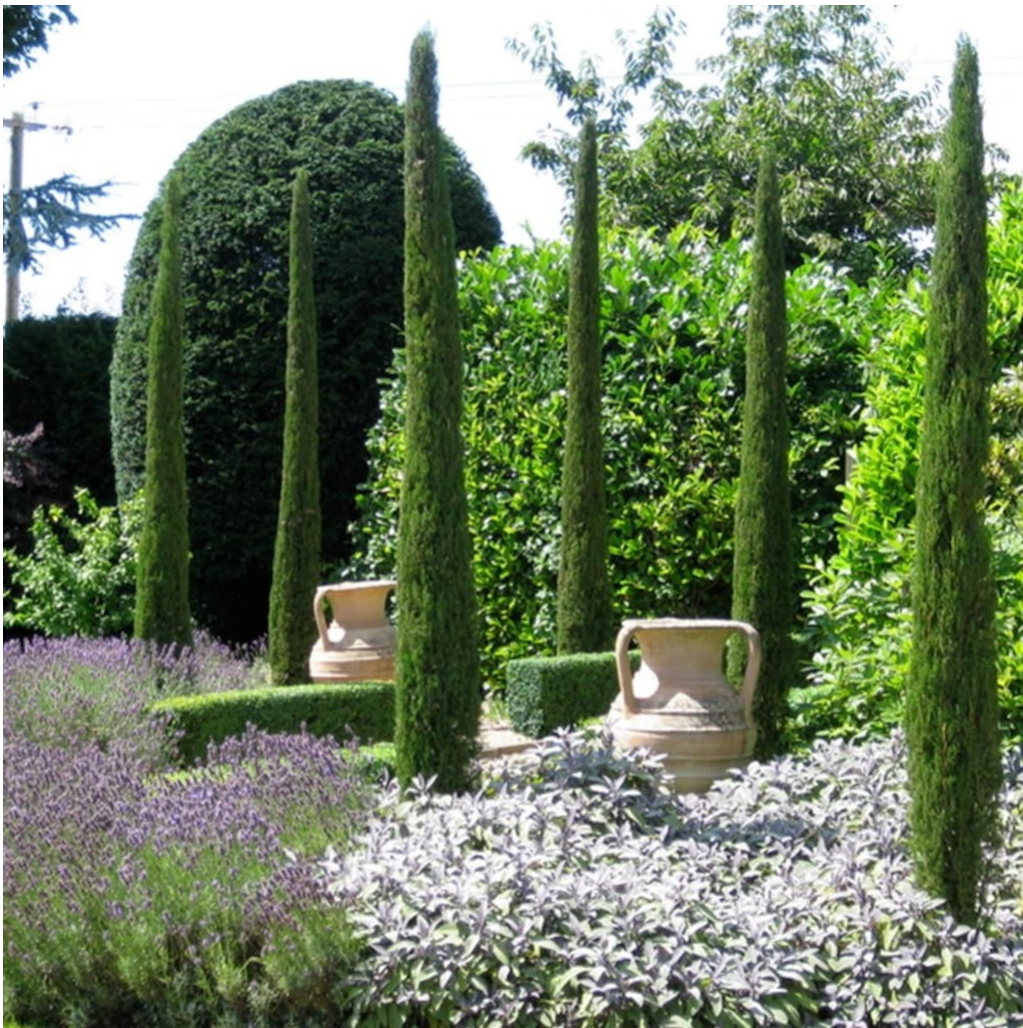
Cupressus sempervirens totem